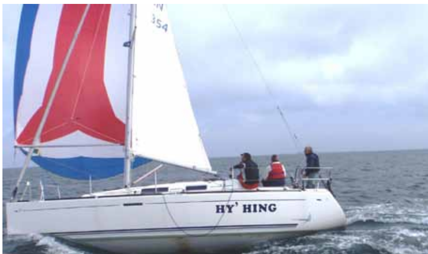
Billedet er taget fra PI.

På turen fra marenskosten og op mod syvstenen skulle vi slå til hvis vi skulle forbi Pi og stadig tænke på de andre både som stadig er bag os, så det var op med spileren og håbe på det bedste et er at sejle op til en Bavaria 38 et andet er at komme forbi pladsen til luv skal vi nok ikke regne med at få så vi måtte tage turen gennem læen