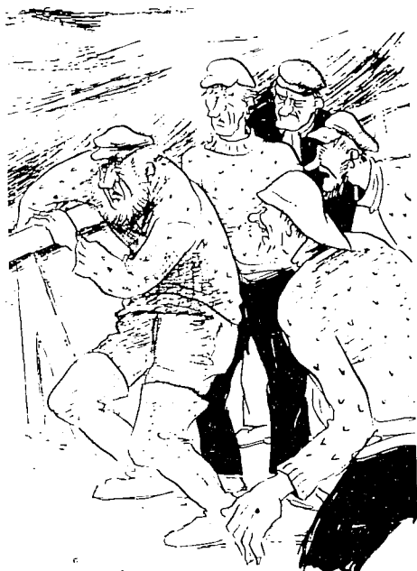
Sømand eller ikke sømand, jeg ER søsyg!

bedste man så kan gøre er faktisk at følge et hollandsk råd om at drikke saltvand. Det lyder måske tåbeligt, men der er det fornuftige i det, at en del af de senere følger af søsygen beror på væsketab, varmetab og salttab. Væsketabet og salttabet kompenserer man ved behersket indtagelse af saltvand. Varmen må man se at holde på en anden måde, og det er vigtigt at undgå afkøling, da søsygen bliver meget værre og farligere, hvis man fryser, så derfor - under tæpperne. Det er naturligvis ikke altid, at det er nok at være udhvilet og veltilpas før man sejler, men det er mere op til den enkelte sejler at vurdere, om der er mulighed for evt. søsyge på den tur man skal på, og hvis det er det, er det absolut af største vigtighed, at søsygemidler indtages i god tid. Et par timer før symptomerne optræder må siges at være passende, da det ofte er sådan, at det første man ser ved Søsygeopkastning er den uopløste søsygetablet, så husk at tage den i god